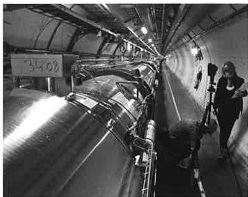
図1 LHC